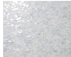
表面の細かな凹凸と光沢