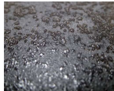
表面の細かな凹凸と光沢